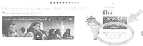
BANNER en Menú Derecho