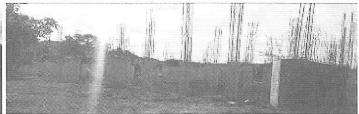
Unidad Académica Departamental Tipo II